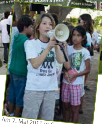
Am 7. Mai 2011 in Cancun, Mexiko Kinder demonstrieren für eine bessere Zukunft

Lasst uns weltweit Bäume pflanzen! Wenn jeder Mensch 150 Bäume pflanzt, schaffen wir 1.000 Milliarden bis 2020.