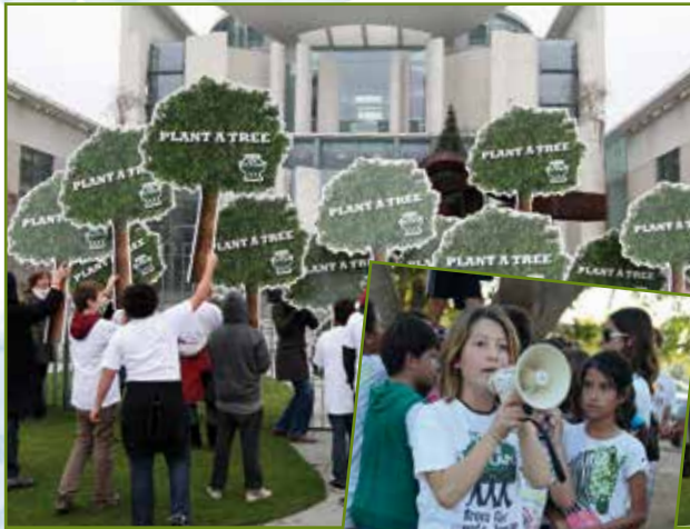
9. Dezember 2009 vor dem Kanzleramt in Berlin

Wenn ein paar Kinder Bäume pflanzen, dann mag der einzelne Baum nicht viel bewirken, wenn sich aber die Kinder der ganzen Welt zusammentun und Bäume pflanzen, dann können wir gemeinsam die Welt verändern. Antonia, 12 Jahre