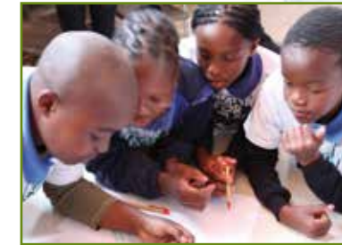
Gemeinsam planen und pflanzen!